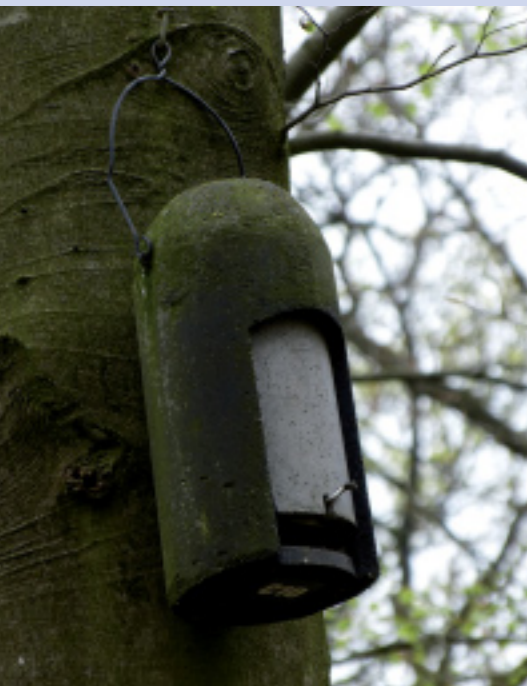
Kleine bolle kast

De meeste vleermuiskasten zijn alleen geschikt om verblijfplaatsen van vleermuizen in bomen of gebouwen tijdelijk te vervangen. Bijvoorbeeld tot een nieuw of gerenoveerd gebouw weer onderdak kan bieden aan vleermuizen. Of wanneer een bos weer voldoende voor vleermuizen geschikte bomen bevat.