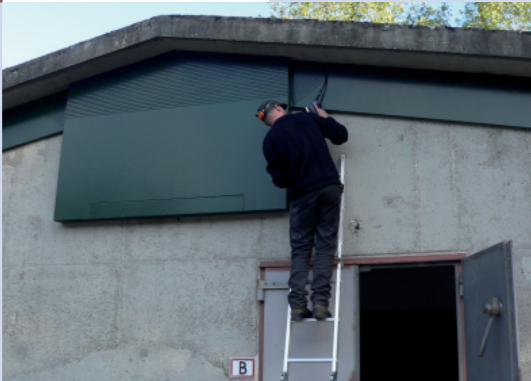
Controleren van een kraamkast

Wanneer vleermuiskasten worden gebruikt om bestaande verblijfplaatsen te vervangen moeten de volgende voorwaarden en succesfactoren goed in de gaten worden gehouden om de vleermuizen succesvol te laten verhuizen.