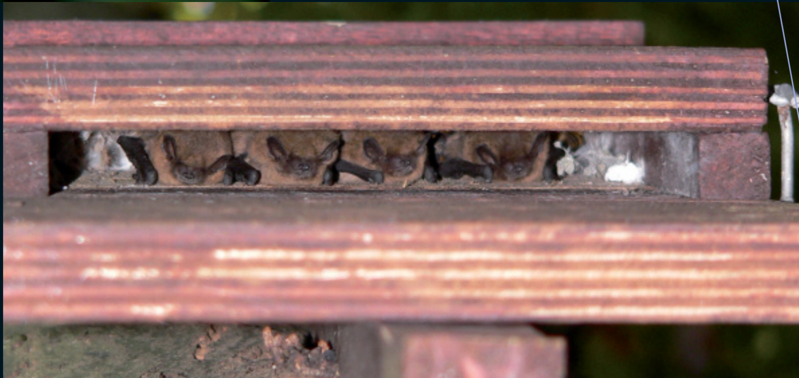
Gewone dwergvleermuizen in platte vleermuiskast

RUIMTE EN TEMPERATUUR spelen een hoofdrol in het succes van vleermuiskasten. Vrouwtjes met jongen hebben een voorkeur voor stabiel warme kasten en kasten waarin ze veilig diep weg kunnen kruipen. Mannetjes zijn vaak al tevreden met een eenvoudige kleine vleermuiskast. Vleermuiskasten zijn meestal niet geschikt als winterverblijf, omdat kasten zelden vorstvrij zijn.